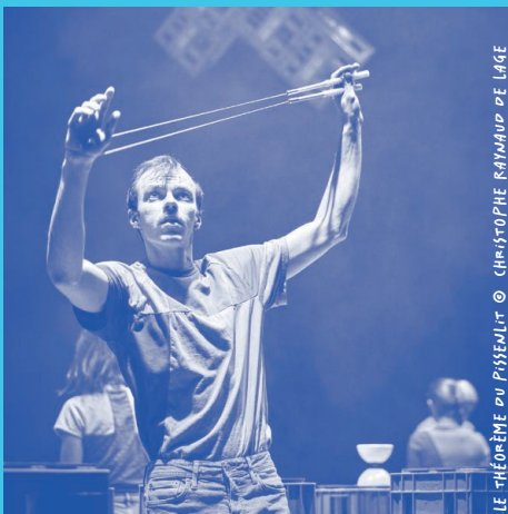
LE THÉORÈME DU PISSENLIT