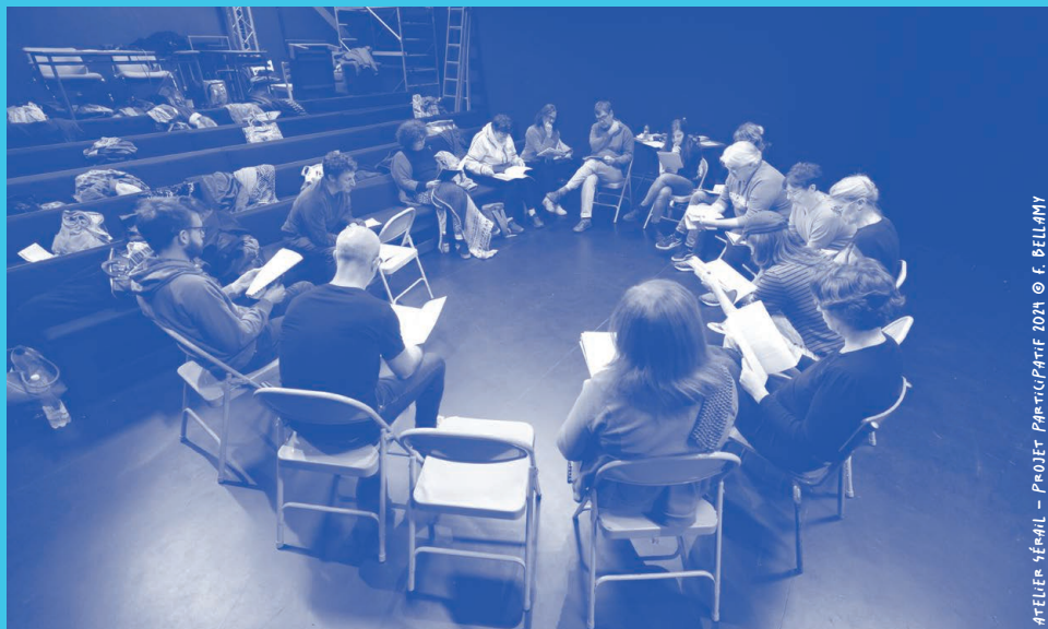
ATELIER - ÉVAL - PROJET PARTICIPATIF 2024