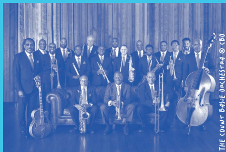
THE COUNT BASIE ORCHESTRA